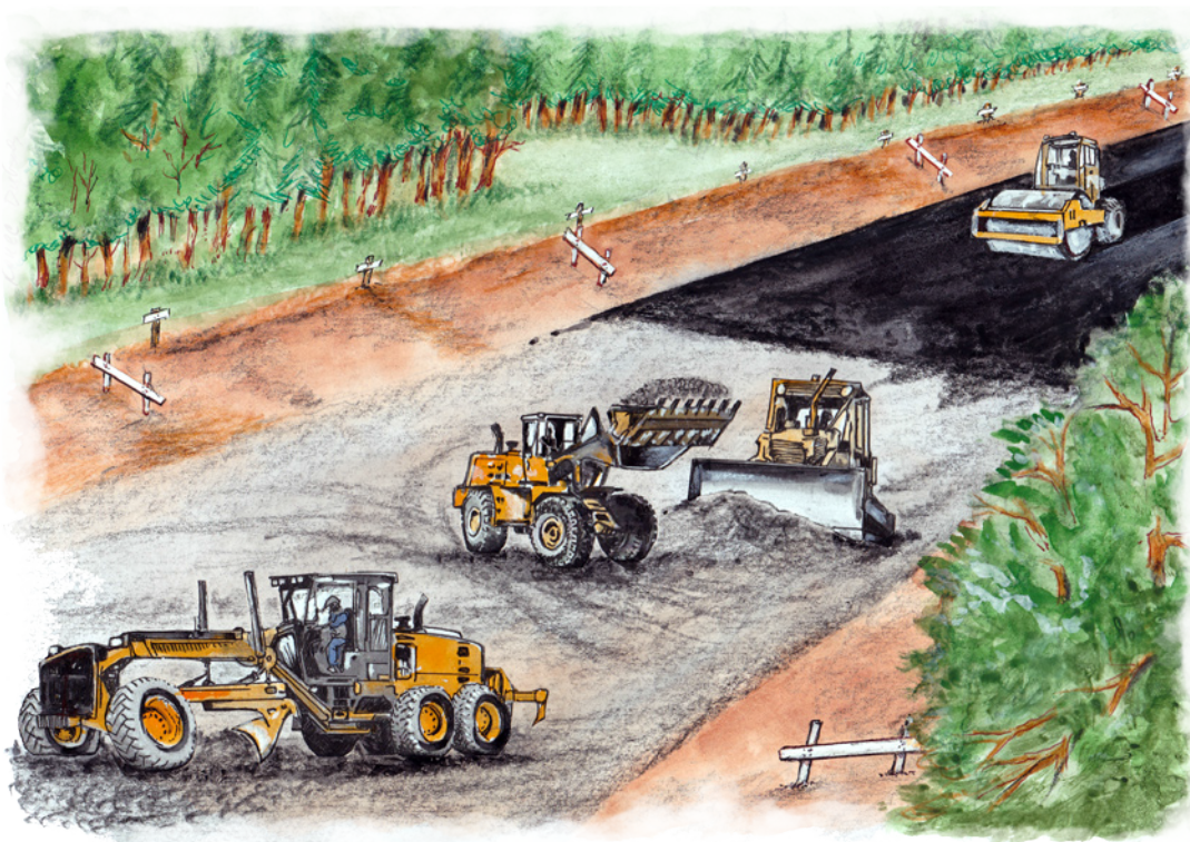
4 - - - - -