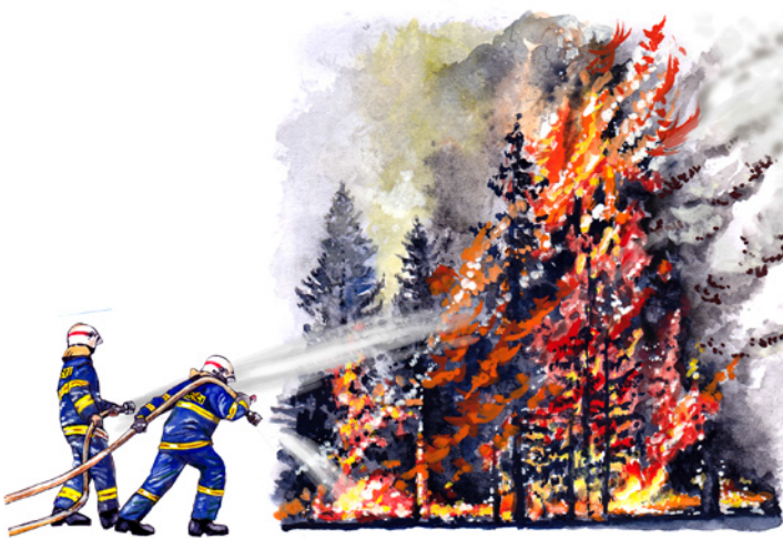
2 - - - - -