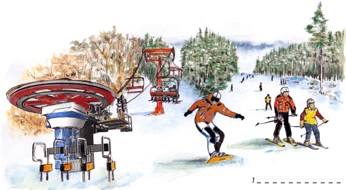
1 - - - - -